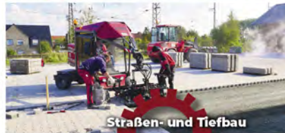
Straßen- und Tiefbau