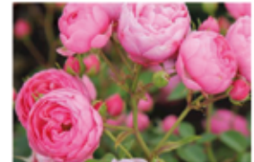
Historische Rose 'Madame Boll'