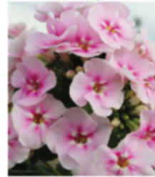
Hohe Flammenblume Phlox 'Younique Bicolor'