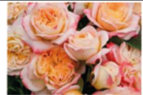
Edelrose 'Amour de Molène'

Auch für Ihren Duftgarten (s.o.) können Sie hier fündig werden. Auch bei den öfter- und gefüllt blühenden Rosen gibt es mittlerweile eine große Auswahl an duftenden Sorten.