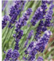
Lavendel Lavandula angustifolia