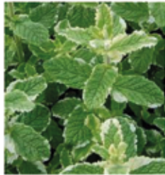
Ananasminze Mentha suaveolens