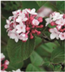
Duft-Schneeball Viburnum carlesii