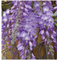
Blauregen Wisteria sinensis