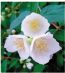
Bauernjasmin Philadelphus coronarius